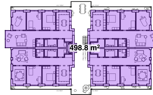
L2, 2. Obergeschoss