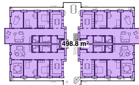
L2, 1. Obergeschoss

Fläche BGFH (Definition nach Quartierplan- reglement QP Hardstrasse Art. 4 Abs. 5)